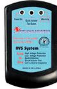
Model No. SVE 1017 Patent No. 15341